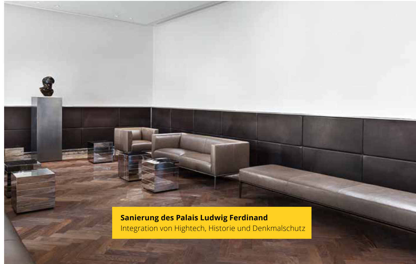
Sanierung des Palais Ludwig Ferdinand Integration von Hightech, Historie und Denkmalschutz